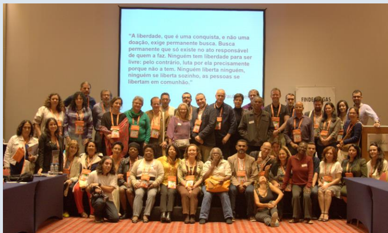
Rio de Janeiro, Julho de 2016