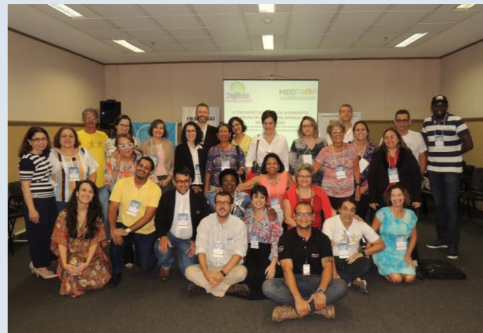
Maceió, Agosto de 2016